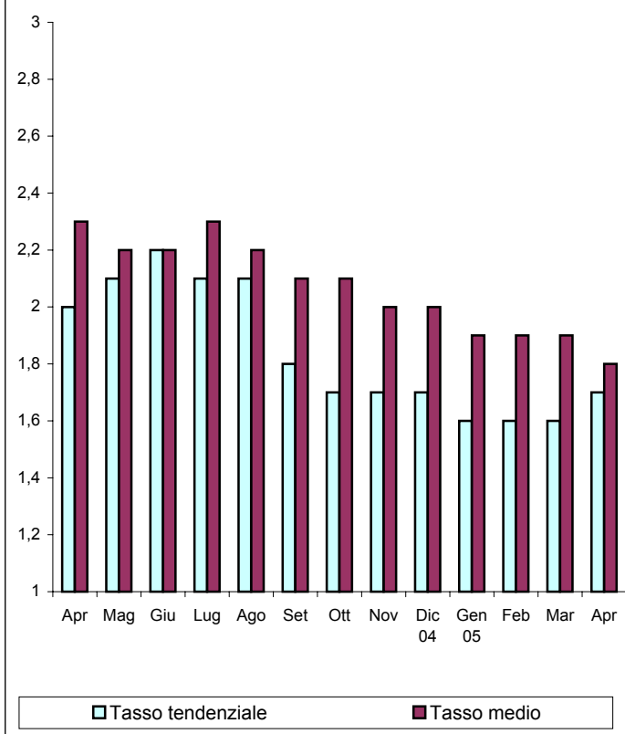
ANDAMENTO DELL'INFLAZIONE IN ITALIA

La variazione dell'indice del mese di Aprile 2005, pubblicato ai fini delle locazioni di immobili urbani, è pari a 1,7 (75%=1,3).