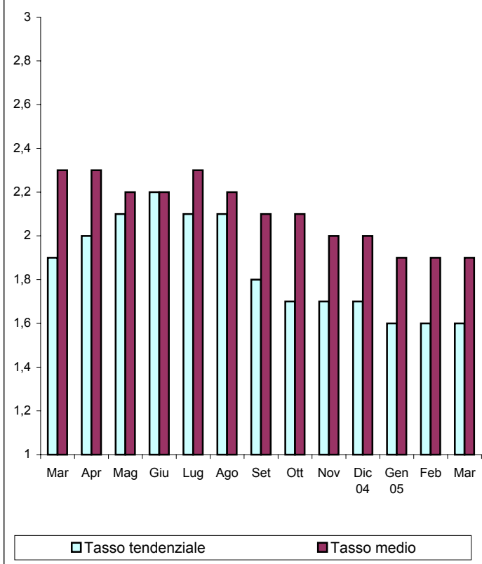
ANDAMENTO DELL'INFLAZIONE IN ITALIA

La variazione dell'indice del mese di Marzo 2005, pubblicato ai fini delle locazioni di immobili urbani, è pari a 1,6 (75%=1,2).